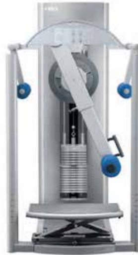
Alle Geräteabbildungen entsprechen nicht der Optik mit FREI GUIDE System.