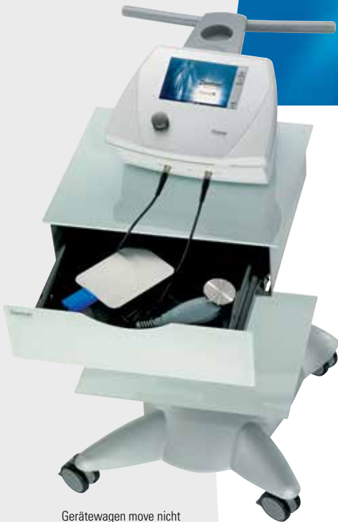
Gerätewagen move nicht im Lieferumfang enthalten Ablageplatte optional