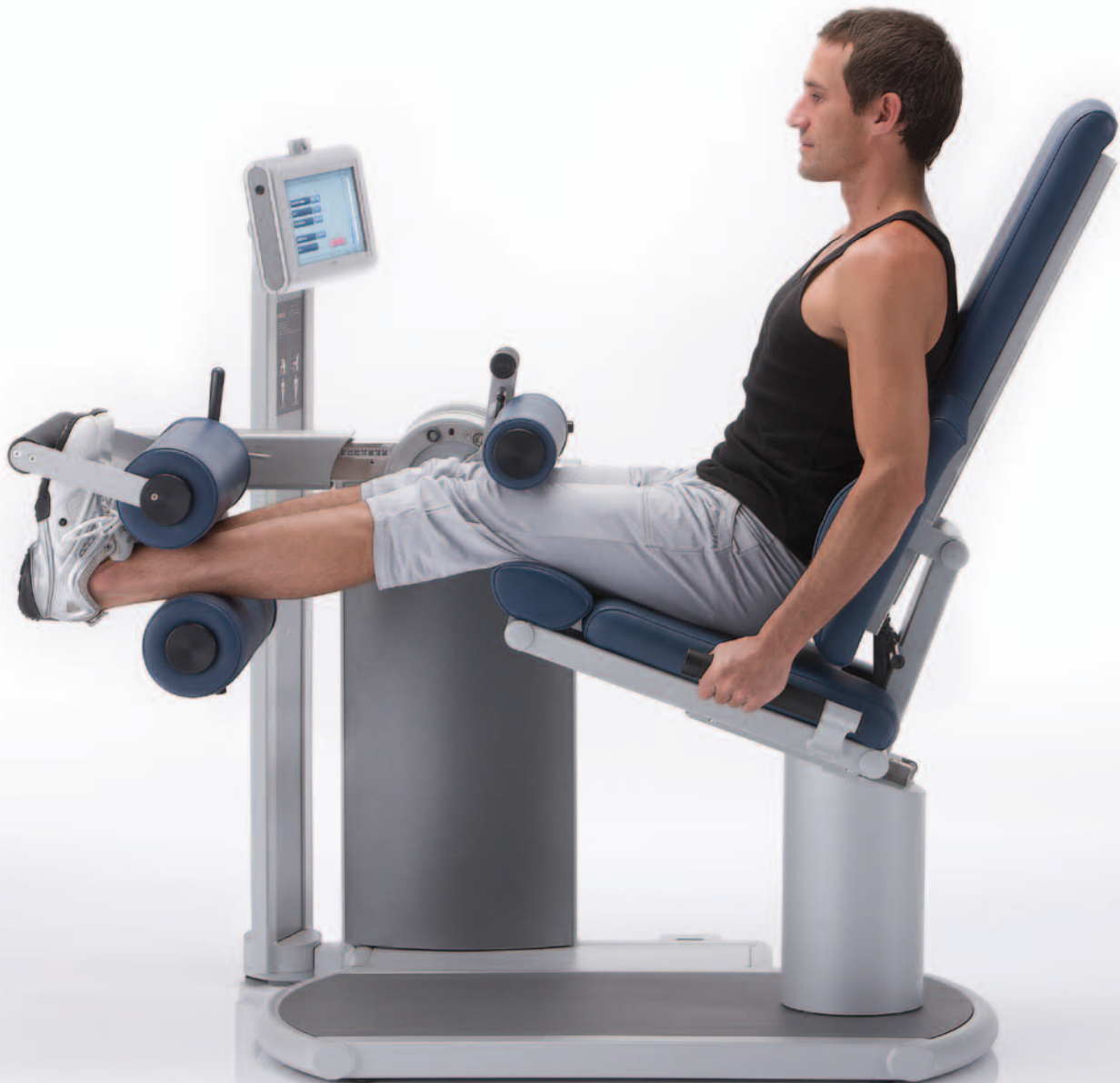
Abb. zeigt Kniebeuger / Kniestrecker mit Option Oberschenkelfixierung